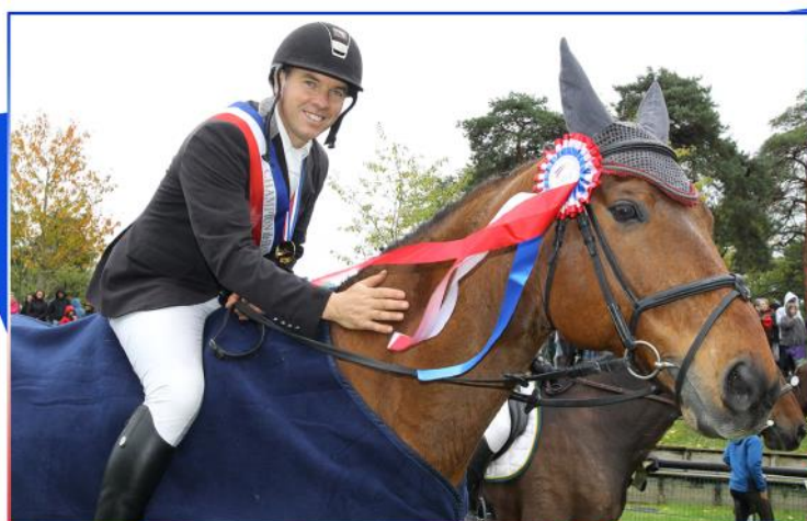
CHAMPIONNAT DE FRANCE AMATEURS CCE FONTAINEBLEAU 2019