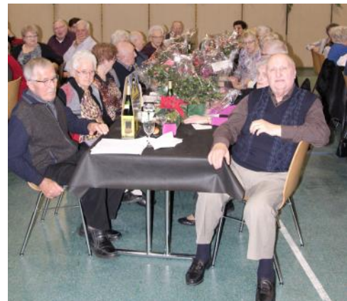
la table des 85 ans qui ont été mis à l'honneur pour les grands anniversaires