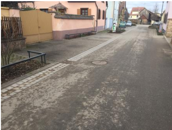
Espace de contournement

Il est rappelé aux riverains de la rue du Buhl et plus globalement à l'ensemble des habitants que le stationnement est interdit sur la rue du Buhl. Aucune place de stationnement n'est matérialisée au sol. Des espaces de contournement ont été mis en place lors du réaménagement de la rue afin que deux véhicules puissent se croiser. En aucun cas ces derniers ne doivent être utilisés pour se garer.