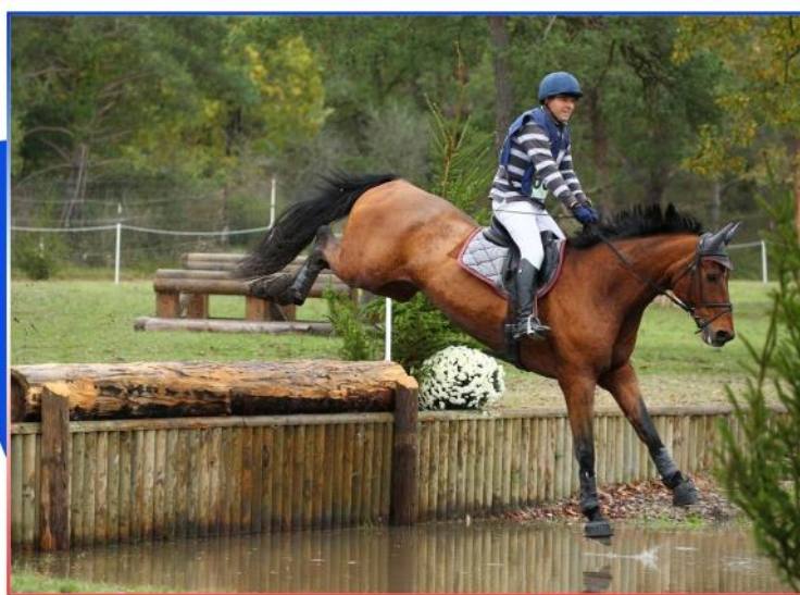
CHAMPIONNAT DE FRANCE AMATEURS CCE FONTAINEBLEAU 2019