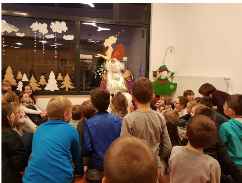
L'équipe des Serpentins

Pendant les vacances d'hiver, le périscolaire embarquera les enfants en direction du Grand Nord à la découverte de la vie sur la banquise. Pour plus de renseignements, vous pouvez contacter Audrey DENNI au 03.88.92.47.75 ou par mail : periscolaire.ebersheim@opal67.org