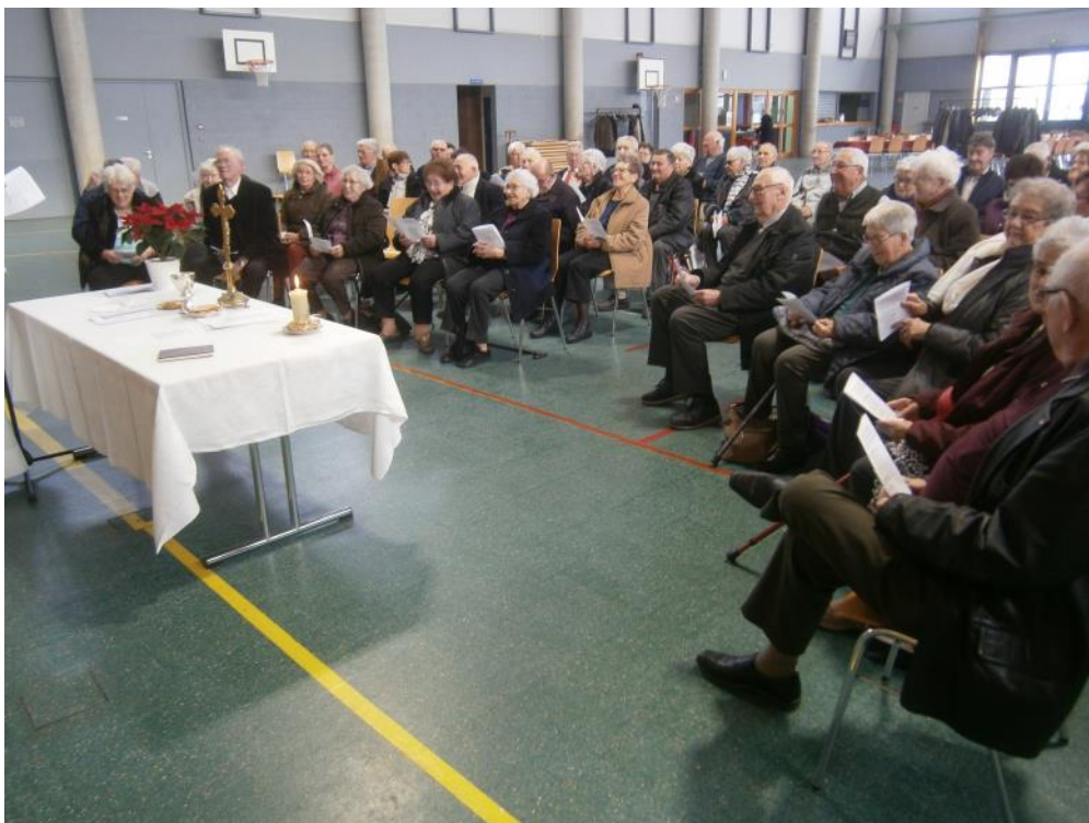
Messe en décembre 2019

« L'important n'est pas d'avoir beaucoup d'années dans sa vie, mais de mettre beaucoup de vie dans ses années ». JF KENNEDY